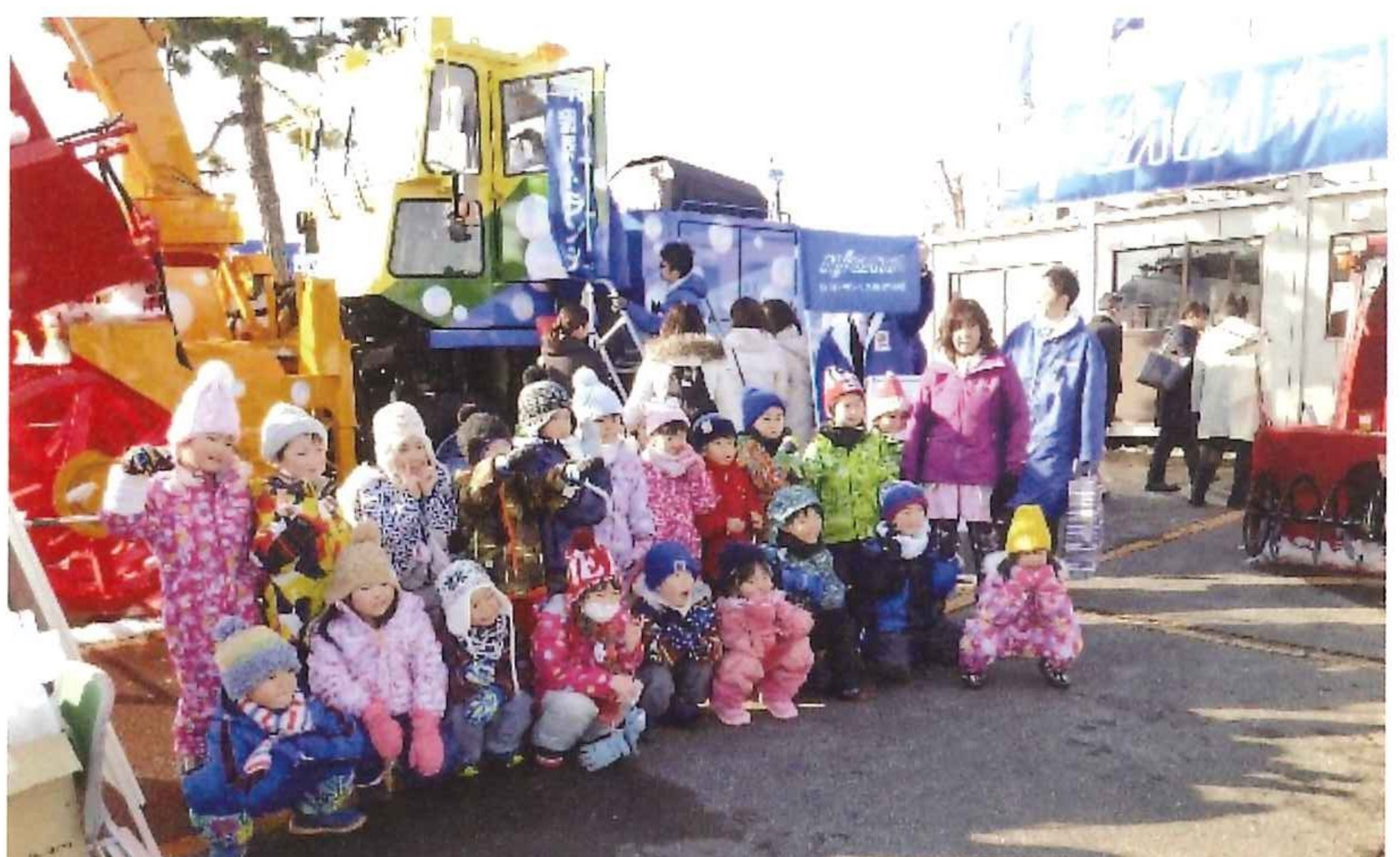
写真-4 函館深堀保育園の園児たち