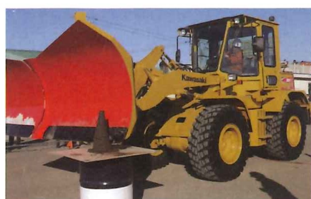
写真-2 競技会 (除雪車チャンピオンシップ)

二日間にわたり小型除雪車(KBR105)による除雪機械の実演が行われ、最新鋭の除雪機械作業に来場者の関心を