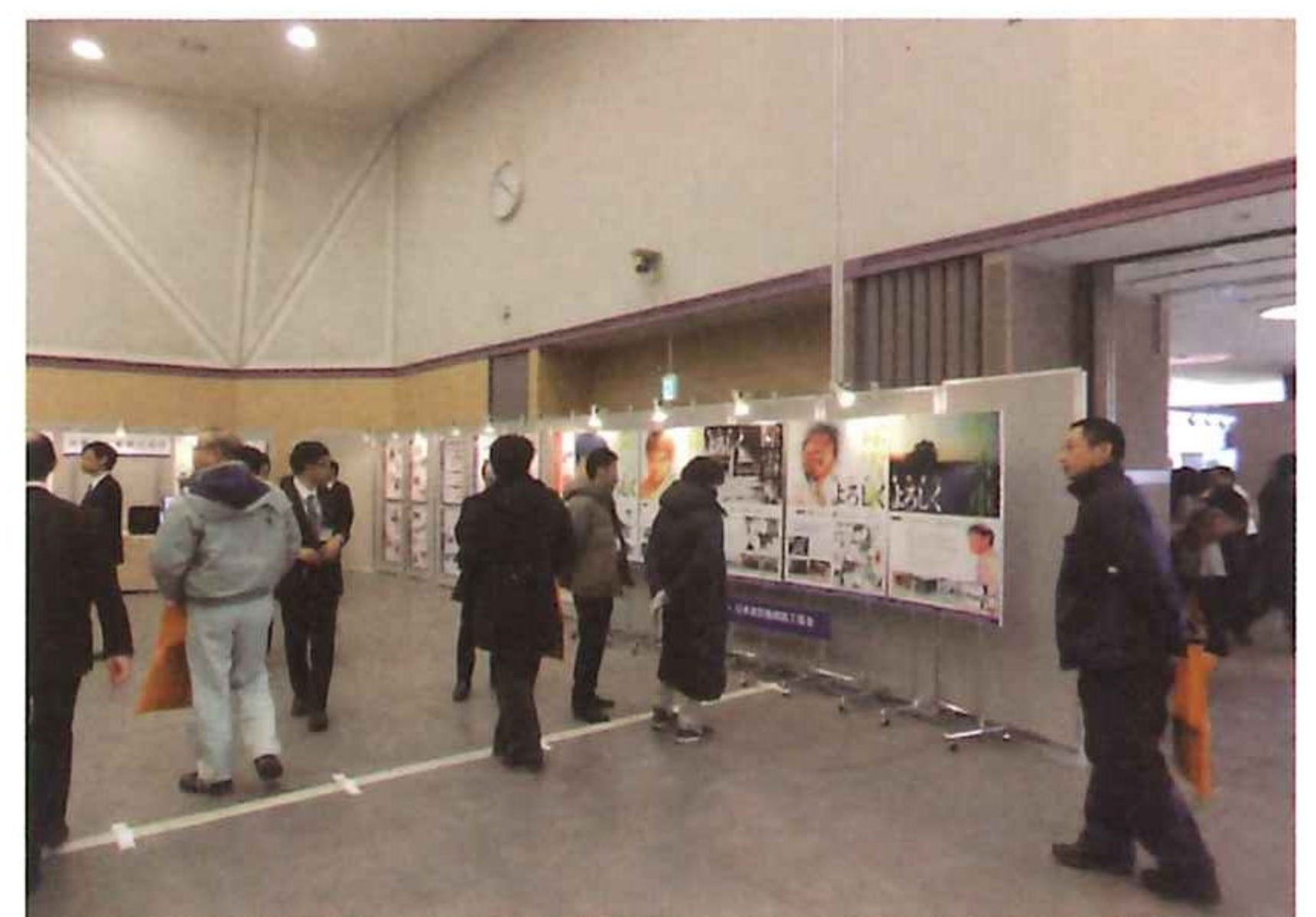
写真-5 除雪車PRポスター 「除雪者によろしく」