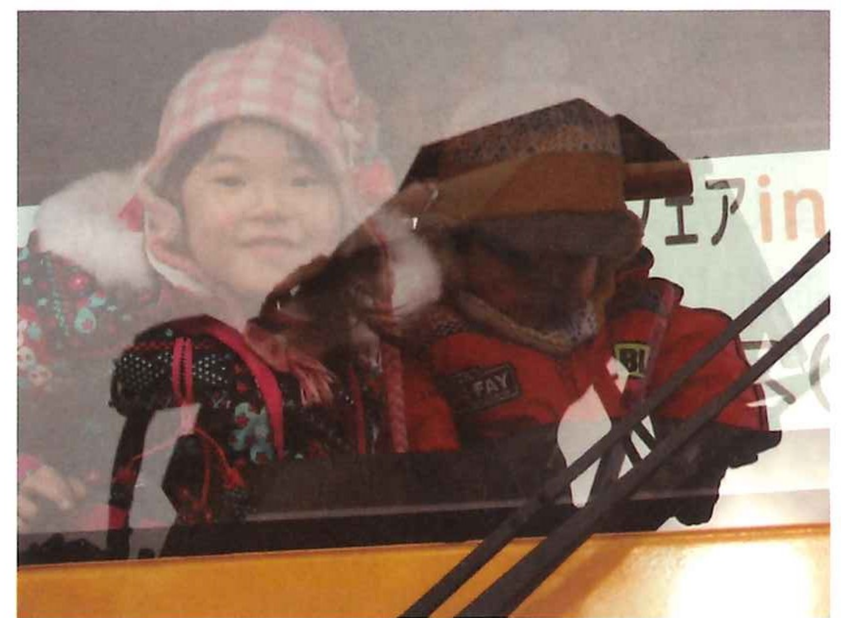
写真-4 幼稚園児の試乗体験