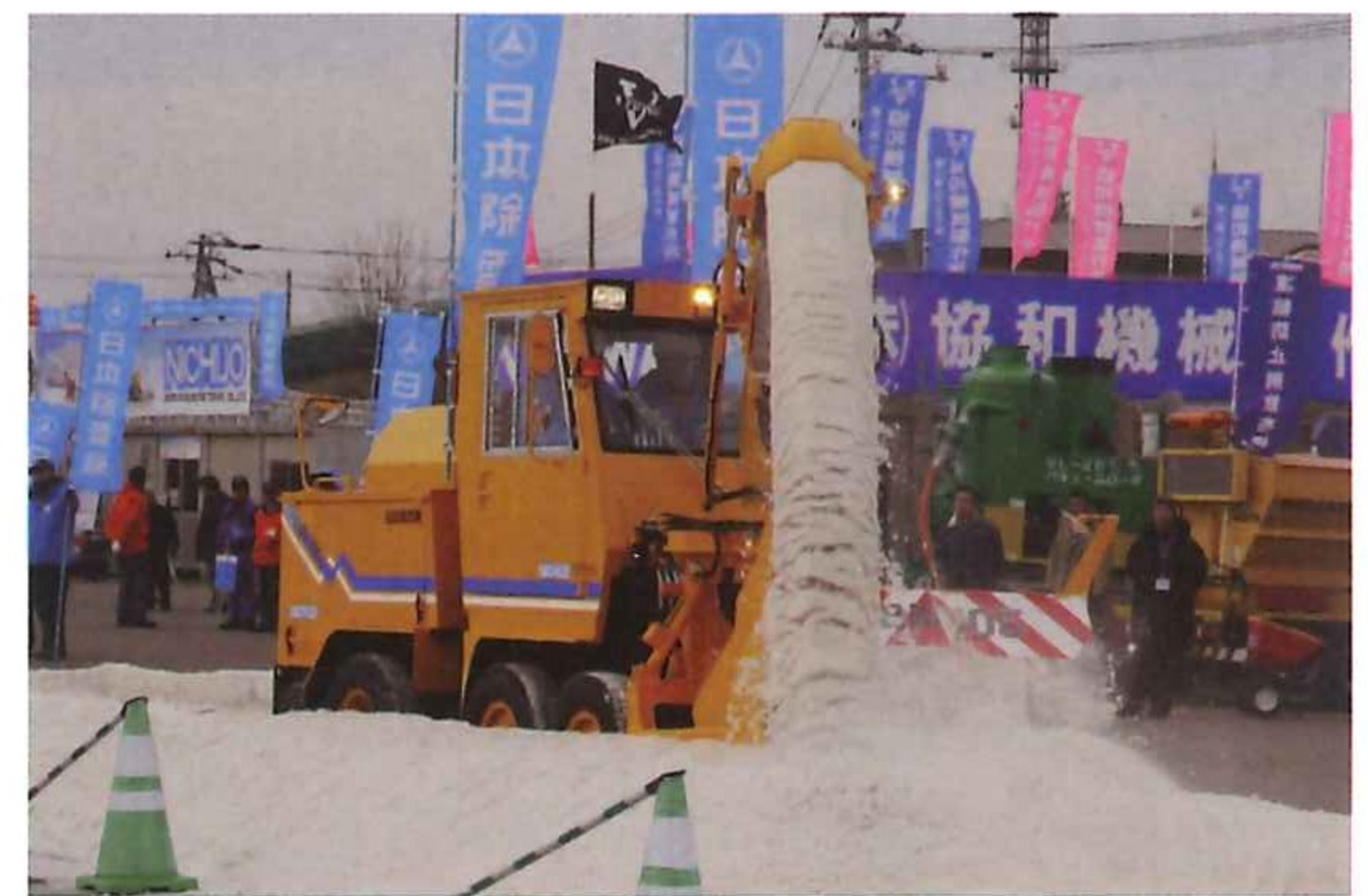
写真-3 ロータリ除雪車の実演