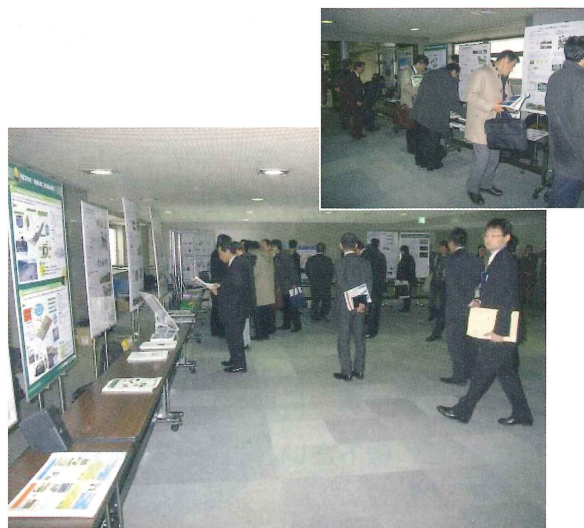
写真-11 ポスターセッション全景

フォーラム会場の受付ロビーには、情報化施工推進検討WGの委員になっている10会社等から今年度の情報化施工試験施工の取組状