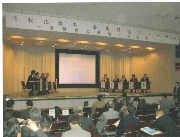
写真-7 パネルディスカッション全景